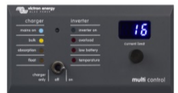
Tableau de commande numérique Multi Control

Afin d'implémenter les fonctions PowerControl et PowerAssist et pour optimiser l'autoconsommation grâce à une sonde de courant externe. Courant maximal : 50 A, 100 A respectivement. Longueur du câble de connexion : 1 m.