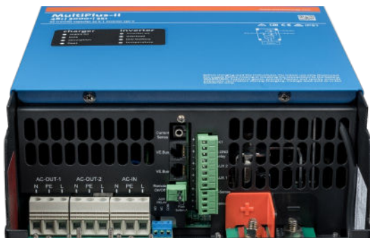
Zone de connexion

Permet de mesurer la tension de batterie et la température et de superviser et contrôler le système avec un Smartphone ou tout autre dispositif équipé de Bluetooth.